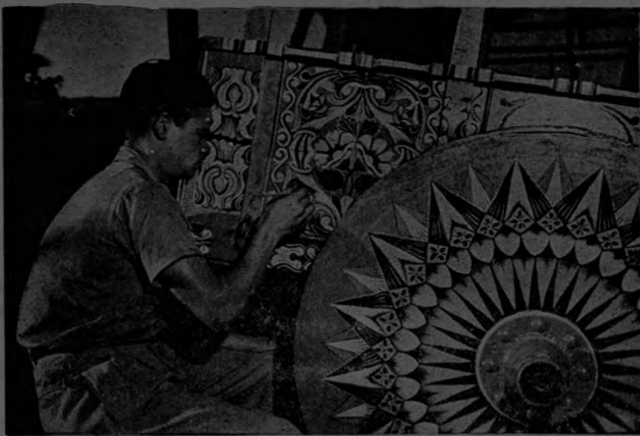
El sentido pintoresco de la rueda de carreta en Costa Rica ya tiene, pues, su expresión popular.—García Monge

Tenemos el privilegio de poseer algo muy típico: las bellas carretas decoradas artísticamente. Hay motivos muy variados. La mayoría son combinaciones de figuras geométricas de diferentes colores que, al girar en las ruedas forman un verdadero arco iris.