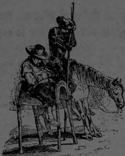
Don Quijote y Sancho Panza

Homenaje al Excmo. Señor Ministro de España y Señora de Cavanillas