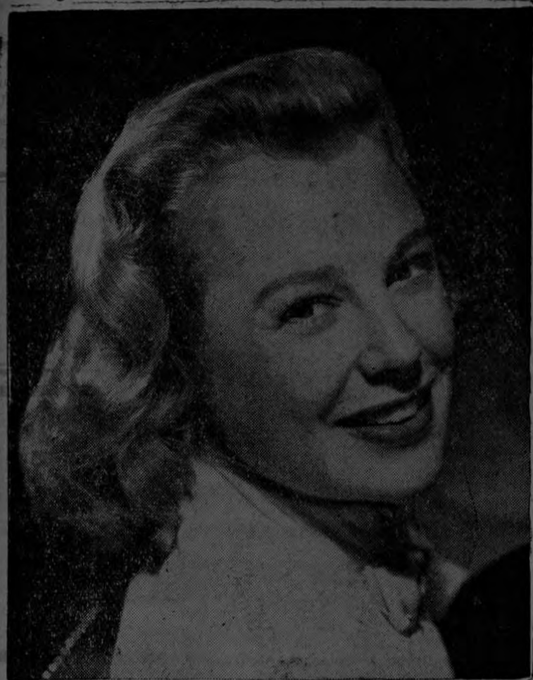
Un estudio de la apariencia de una actriz tan encantadora e inteligente como JUNE ALLYSON, estrella de MGM, probará que el arreglo personal alcanza perfección cuando se lleva a cabo con el lugar y la hora en que se presenta, según Max Factor, Jr.

MAX FACTOR, JR. SUPREMA AUTORIDAD EN MAQUILLAJE DE LAS ESTRELLAS DEL CINEMA