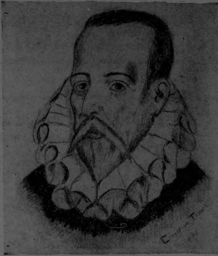
Don Miguel de Cervantes Saavedra Autor de la Inmortal obra literaria El Ingenioso Hidalgo Don Quijote de la Mancha