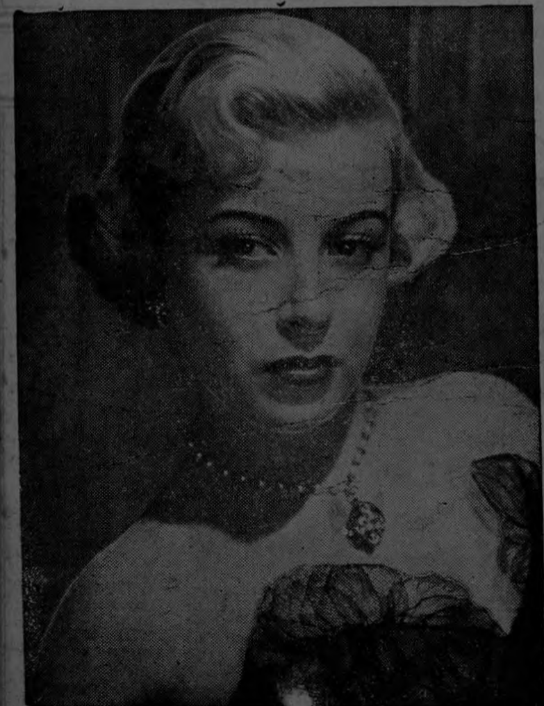
Gloria de Haven, actriz de la Metro Goldwyn Mayer

Gloria De Haven, cuya espiritual belleza y talento dramático se han combinado para colocarla entre las más conspicuas personalidades de Hollywood, confiesa que el arte histriónico es parte de su ser. Sin que ella pueda remediarlo, la atrae como un imán hacia su carrera, no obstante que dos veces ha tratado de abandonar esta para dedicarse por